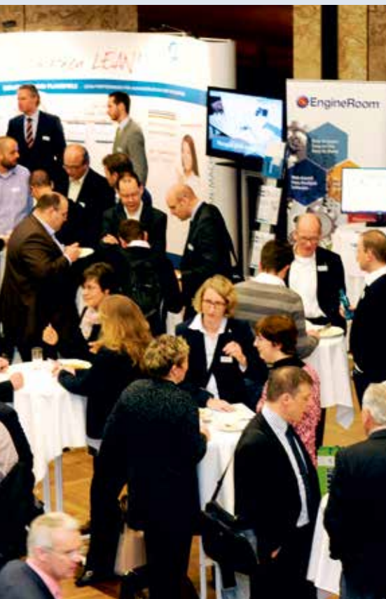
Mehr als 270 Teilnehmer bei der Lean-Konferenz 2015